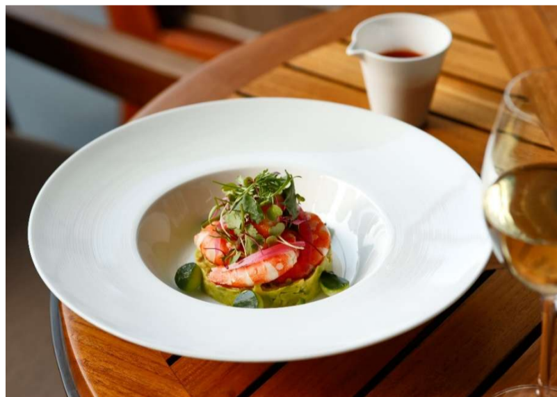
シュリンプとアヴォカドのカクテル Shrimp and avocado cocktail

Deep-fried prawns with tartar sauce and lemon ¥3,900