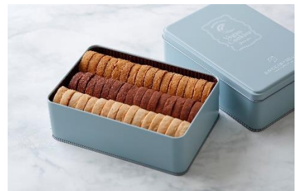
ヴィーガンクッキー缶