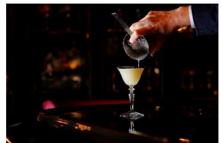
メインバー ロイヤル バー 洋梨とディルのフレンチギムレット