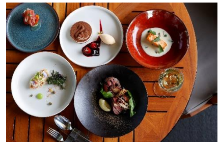
オールデイダイニング グランド キッチン 10周年アニバーサリーコース