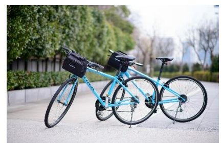
サイクリングイメージ