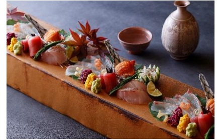
日本料理 和田倉 「和 -NAGOMI-」