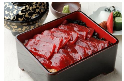
本まぐろの鉄火重