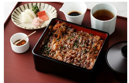
国産牛リブロースのステーキ重