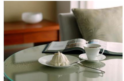
マロンシャンティイ