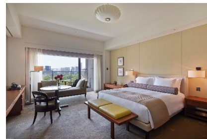
バルコニー付き客室