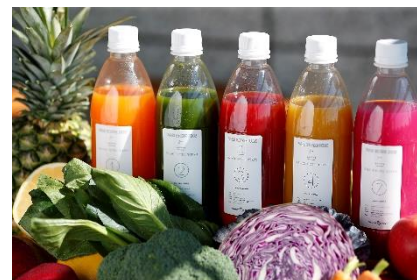
ジュースクレンズイメージ