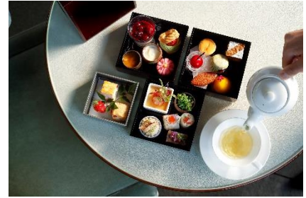
アフタヌーンティー

バルコニー付きのお部屋で、昼(アフタヌーンティー)・夜・朝食の3食をゆったりとお召し上がりいただく24時間滞在の宿泊プラン。誰にも邪魔されないプライベート空間ならではの上質な食体験をお楽しみください。