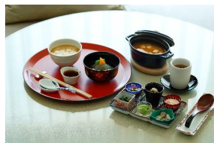
オリジナル回復食