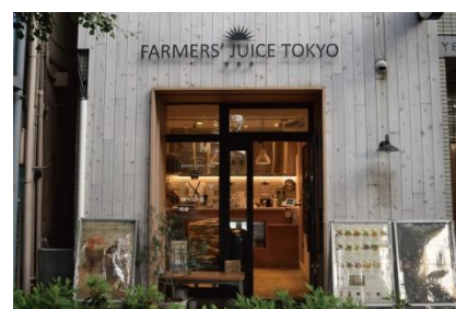
FARMERS' JUICE TOKYO 店舗外観

『世界をもっとヘルシーに、サステナブルな社会へ』をミッションに掲げるジュースバー。最高の食材を使って熱を加えずにプレスした完全無添加、搾りたてのコールドプレスジュース・スムージーを提供しています。搾りたてを提供するので時間がかかり、完全無添加のため保存もききませんが、便利さや手軽さと引き換えに失ってきた、かつては当たり前だった安全で健康的な食生活を再び提供できればと考え、日々活動を続けています。