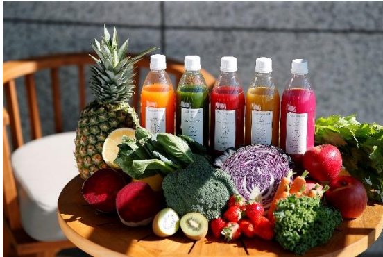
ジュースクレンズイメージ