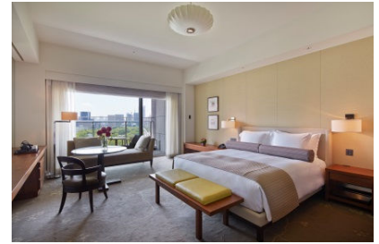
デラックスキング with バルコニー

「文喫」のブックディレクターが事前に行うアンケートをもとに選書した本を一人につき3冊ご用意。ご宿泊中、解放感のあるバルコニー付きのお部屋で優雅に読書をお楽しみください。書籍はそのままお持ち帰りいただけます。他、文喫六本木への入場券も付きます。