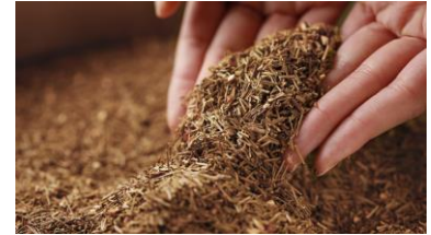
国産天然成分配合「warew」

日本の美を極める「warew」の製品を使用したフェイシャルトリートメント。ウメ根エキス、アカマツ葉エキス、ヤマザクラ樹皮エキス、ホオノキ樹皮エキスの4種の生薬由来成分を有効に働く黄金比で配合し、肌のハリや艶、輝きなどの*エイジングケア効果をもたらします。