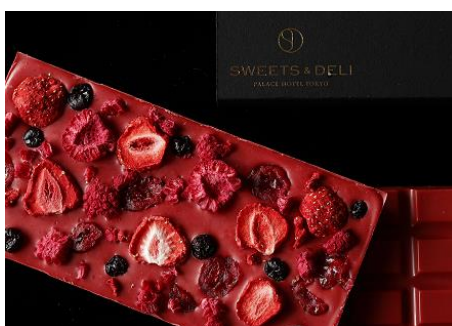
タブレット ド ショコラ(フリュイ)