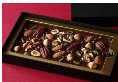
タブレット ド ショコラ(ノワ)

ナッツをふんだんに使用した贅沢なタブレット型ショコラ。上品な甘さのミルクチョコレートと風味豊かなナッツが織りなす深みのある味わいを楽しめます。