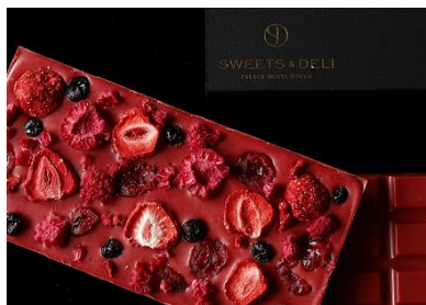
タブレット ド ショコラ(フリュイ)

ドライベリーをふんだんに使用した贅沢なタブレット型ショコラ。力強い酸味とほのかに甘みの特徴のフルーツ・クーベルチュールのストロベリーテイスト、『インスピレーション・フレーズ』にベリーをたっぷり散りばめました。