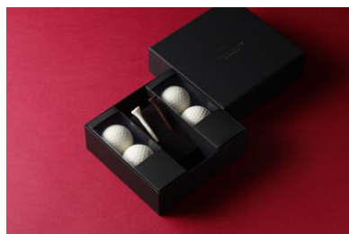
ティー&ボールセット

本物と見紛うほど精巧な仕上がりの、ゴルフボールをモチーフとしたショコラ。ホワイトチョコレートでできたボールの中には、ナッツをコーティングしたショコラが入っています。