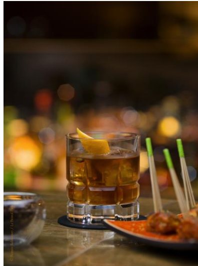
Le Bristol Old Fashioned N° 1