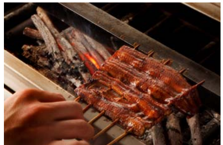
四万十鰻のうな重 8,400円(ランチタイム限定)

提供店舗 : 6F 日本料理「和田倉」 提供期間 : 2013年6月1日(土)～2013年8月31日(土) 提供時間 : ランチ 11:30～14:30 ディナー 17:30～22:00 お問い合わせ : 03-3211-5322