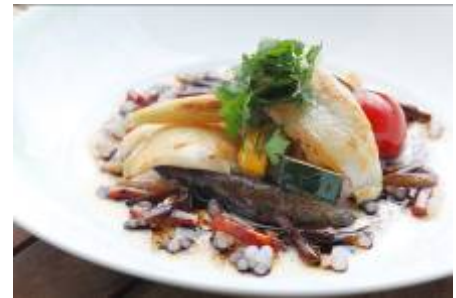
的鯛と夏野菜のニンニク香るチョリソーと バルサミコソース 3,200円