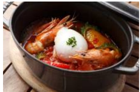
大山鶏と天使の海老のトマト煮 温泉卵のマレンゴ風 3,200円