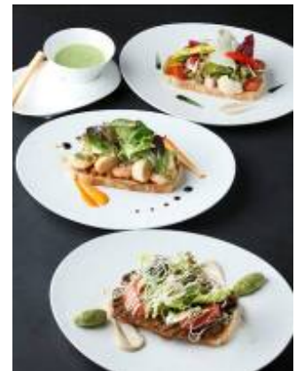
タルティース・プリヴェ