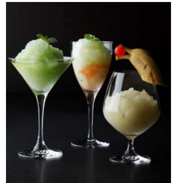
サマーフローズンカクテル