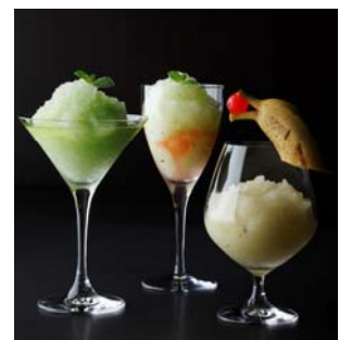
サマーフロズンカクテル

提供店舗 : 6F ラウンジバー「プリヴェ」 提供期間 : 2013年7月1日(月)～2013年8月31日(土) 提供時間 : 11:30～24:00 ※金曜日・祝前日(平日のみ)は 25:00 まで お問い合わせ : 03-3211-5319