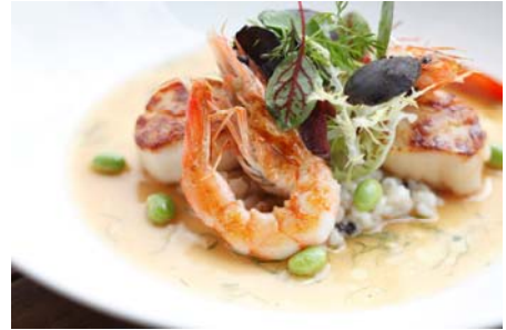
北海道産帆立貝と大麦のリゾット サマートリュフを散らして 3,400円

メニュー / 料金 : ブレックファースト 2,500円～ ランチコース 2,900円 / 3,800円 ディナーコース 3,500円 / 5,500円 / 6,500円