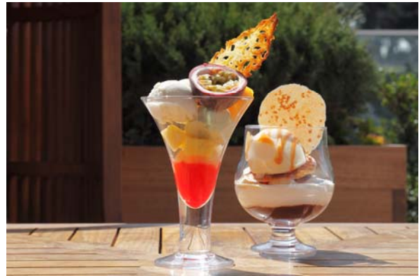
パフェ トロピカルフルーツ(左) ダブルチョコレート(右)

パレスホテル東京(本社:東京都千代田区丸の内 1-1-1、総支配人:渡部勝)では、2013年の夏を彩る目にも涼やかなコールドスイーツをご提供いたします。