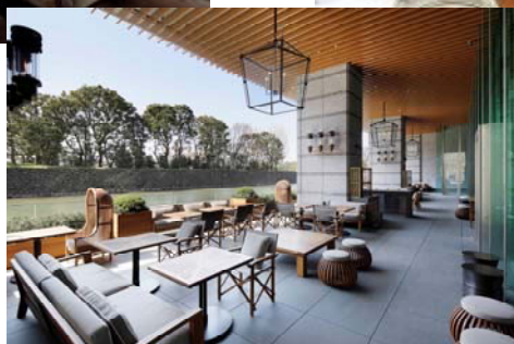
グランド キッチン テラス席