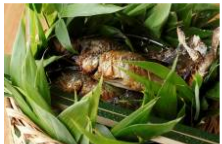
長野県天竜鮎の塩焼き 3,150円