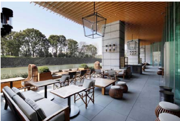
「グランド キッチン」テラス席

・オールデイダイニング「グランド キッチン」: 水辺のテラス席で涼やかに彩るトロピカルフルーツパフェやスムージーを堪能 ・ラウンジバー「プリヴェ」: プライベート感あふれるテラスで楽しむ、フレッシュフルーツが香るサマーフロズンカクテル