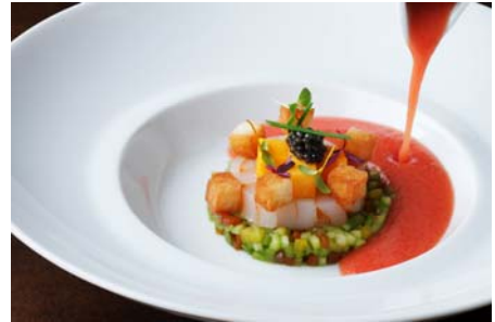
スパイス風味トマトのガスパチョ モザイク仕立ての赤鳥賊と 完熟マンゴー オシェトラキャヴィアクルトン 4,200円

提供店舗 : 6F フランス料理「クラウン」 提供期間 : 2013年6月1日(土)～2013年8月31日(土) 提供時間 : ランチコース 11:30～14:00 ディナーコース 17:30～21:30 お問い合わせ : 03-3211-5317