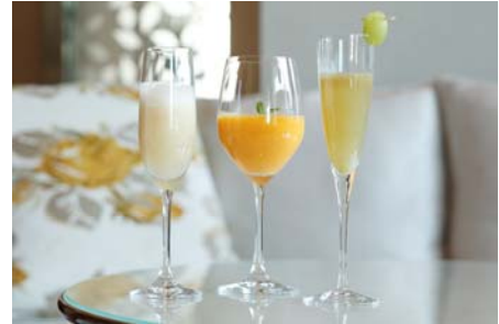
サマー・シャンパン・カクテル

提供店舗 :1F メイン バー「ロイヤル バー」 提供時間 :11:30～24:00 ※金曜日・祝前日(平日のみ)は25:00まで ※土曜日・日曜日・祝日は17:00～24:00まで お問い合わせ :03-3211-5318