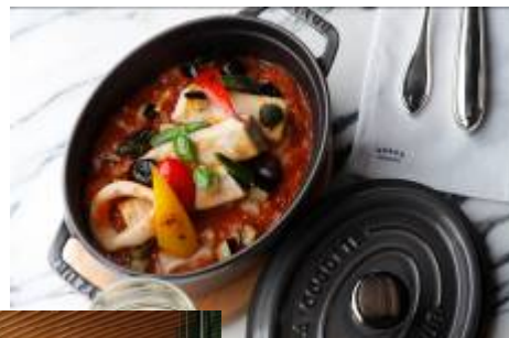
グランド キッチン ディナー写真