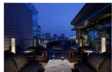
プリヴェ テラス席