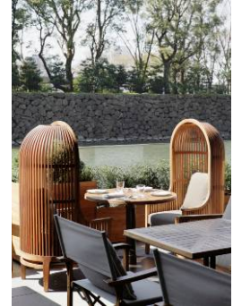
グランド キッチン テラス席

提供店舗 : 1F オールデイダイニング「グランド キッチン」 提供期間 : 2013年5月1日(水)～2013年8月31日(土) 提供時間 : 11:00～23:00 お問い合わせ : 03-3211-5364