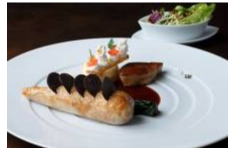
パンタード胸肉をハーブとともに優しく火を入れて サマートリュフのピケ トウモロコシのフランとフォアグラポワレ ランティエユのサラダ 軽く煮詰めたジュにサリエットの香り 6,800円