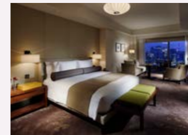
グランドデラックス (和田倉噴水公園側/55㎡)

デラックス、グランドデラックスのクラブルームご利用は、 上記料金に1名様追加料金(¥8,250/1泊)となります。<サービス料・消費税税込>