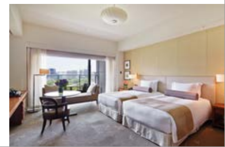
デラックス(和田倉噴水公園側/45㎡) *ツインベッドまたはキングベッドを ご用意しております。