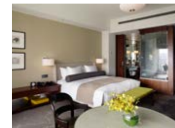
デラックス(内堀通り側/45㎡) *キングベッドのみとなります。