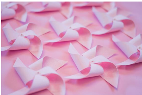
インスタレーション「Pink Petals」イメージ