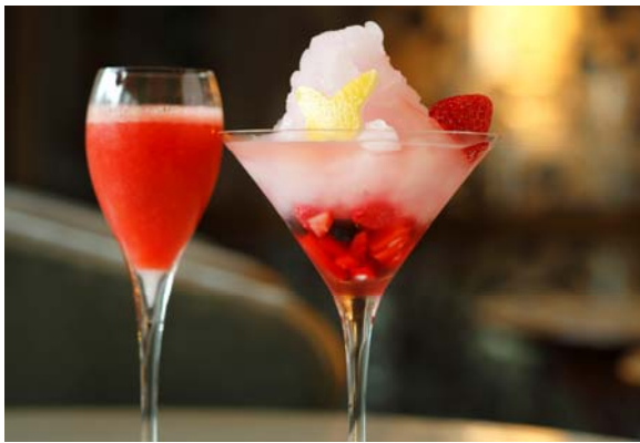
(左)桜苺、(右)雪解け果実