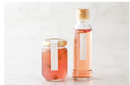
桜のコンフィチュール (左)、桜のハニーシロップ (右)