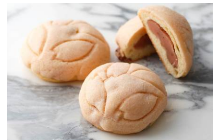
さくらめろんぱん