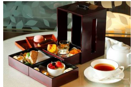
春のアフタヌーンティー

ジャンボンブランと菜の花のサンドイッチ、空豆・新玉ねぎ・ベーコンのキッシュ、新じゃがのクロメスキ、ピンチョス、コルニッション、セミドライフルーツ、山菜稲荷寿司、クランベリーのスコーン、デニッシュ、季節の和菓子、エクレア、フルーツ&ヨーグルトムース、ケーキオランジュ、オリジナル・ブレンド・ティー・セレクション