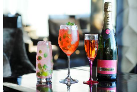
桜モヒート(左) ロゼ・シャンパンモヒート(中) パイパー・エドシック ロゼ・ソヴァージュ(右)

◆パイパー・エドシック ロゼ・ソヴァージュ グラス 2,400 円 ボトル 14,000 円