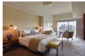
グランドデラックス (和田倉噴水公園側/55㎡) *ツインルームまたはダブルルームをご用意しております。