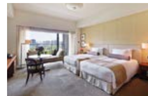
デラックス (和田倉噴水公園側/45㎡) *ツインルームまたはダブルルームをご用意しております。